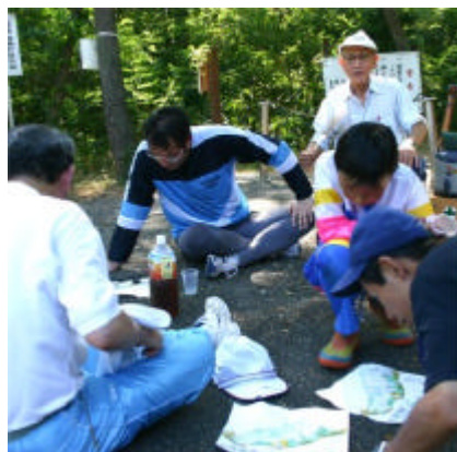
北信越連協合宿。ミニレース後、地図を見てルート検討。