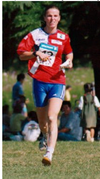
1999年10月11日日本で最初に行われたパークワールドツアーを走る選手(東京・立川 昭和記念公園)