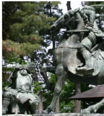
テレインは川中島古戦場近く信玄と謙信が直接刃を交えたと言う

少年野球の子供たちも早い子で 20 分弱、遅い子でも 1 時間強で全部回ってきました。オリエンテーリングの初陣を飾る少年にはこのくらいのコースがちょうど良いでしょう。