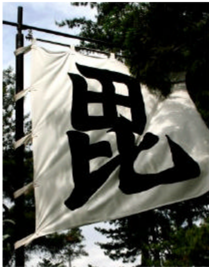
謙信の居城「春日山」に攻め入る!

上越市 OLC 大会 (第 26 回) 2004 年 5 月 30 日 (日) 新潟県上越市春日山