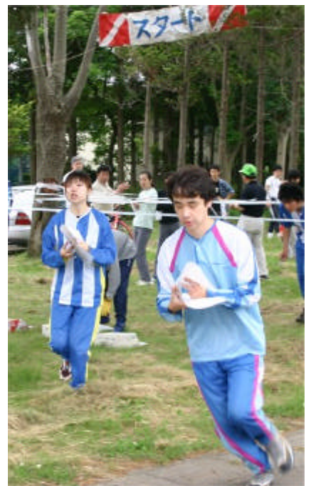
スタートは会場近くの駐車場から。 アクセス 誘導などのレイアウトがとてもコンパクトでとても参加しやすい。