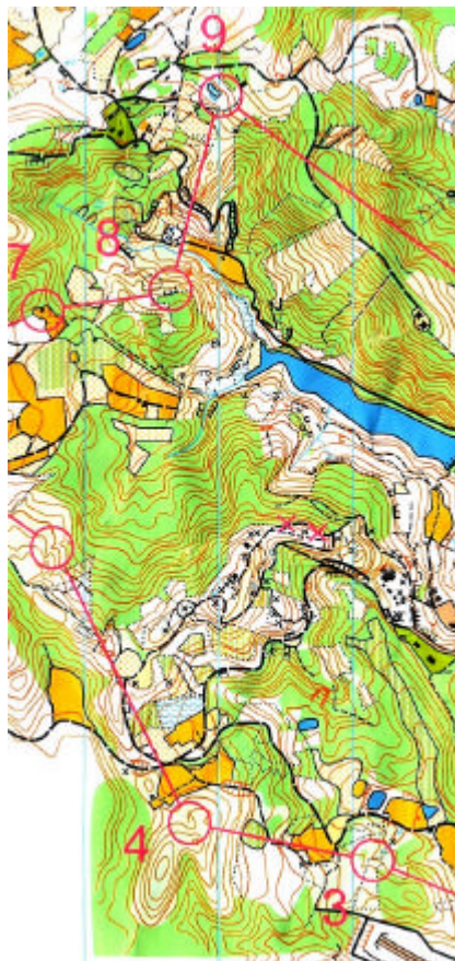
トレイン中央部が謙信の居城跡 森は深く コースはタフな山岳コース

上越市 OLC 大会は一部で「元木チャレンジ」とも言われており、新潟の米を信濃から防衛する勇者の登場を地元は密かに待っているようです。