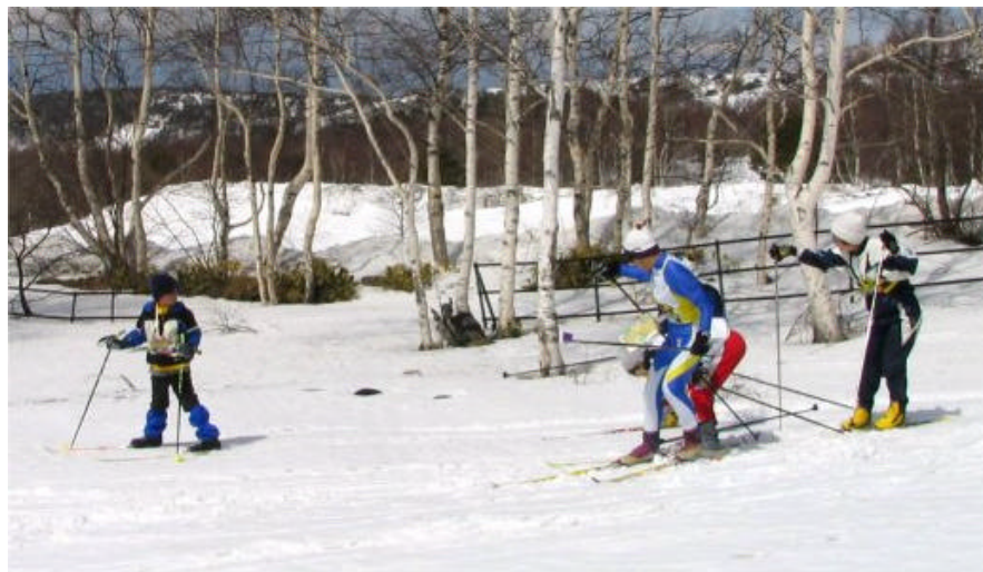
牧場でのミニオリエンテーリング 好天の中、競技派から小学生までが自由に走れる雪原を楽しむ。

今回はいつものような「XC用の整備されたコース+モービルで圧雪した道」ではなく、フット0でお馴染みの牧場を使っての練習でした。どこまでも自由に滑ることができるため楽しいといえば楽しいのですが、大変といえば大変でした。