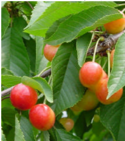
山形名産さくらんぼ(佐藤錦)

2日目の表彰式の後には「お楽しみ抽選会」を行う予定です。2日間の事前申込者に当たる確立を高くした抽選をします。もちろん当日申込の方にもチャンスはあります。賞品はさくらんぼやその他いろいろです。お楽しみに。