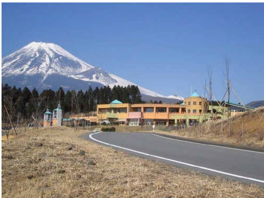
おなじみ、子どもの国が 5 月 16 日スプリントの会場となる。森と人工的なエリアが混在する子どもの国は、日本代表選手にとって 9 月の世界選手権へのよいトレーニングとなるはず。

ワールドカップに使われた地図を、プロマッパーのロブ・ブローライトがスプリント用にリニューアル。子どもの国でのオリエンテーリングの幅が一段と広がる！