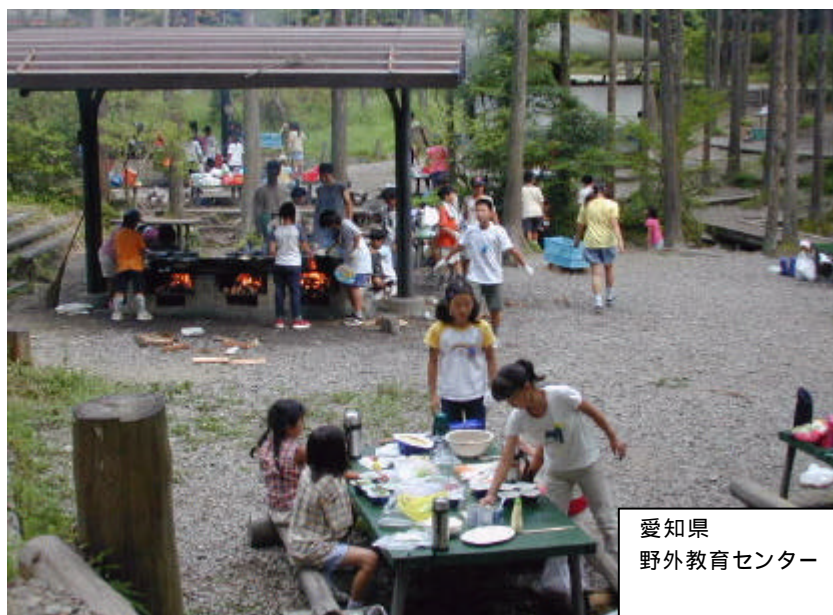
愛知県 野外教育センター