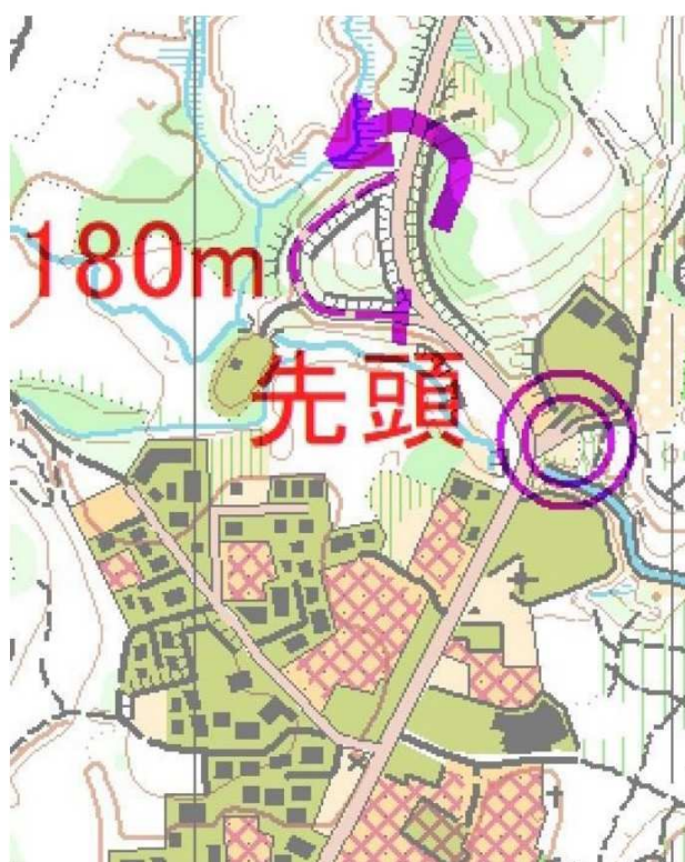
駐車場の拡大図(矢印に従って停めること)