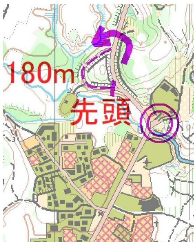
駐車場の拡大図(矢印に従って停めること)

クラス: Long 距離 4~5km, Middle 距離 3~4km, Short 距離 2km