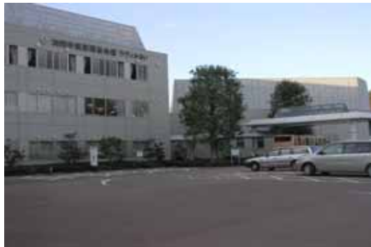
加西市健康福祉会館外観

播磨国風土記による根日女の恋伝説で知られる玉丘古墳をはじめ、いこいの村はりまなど、美しい自然を舞台に実施します。