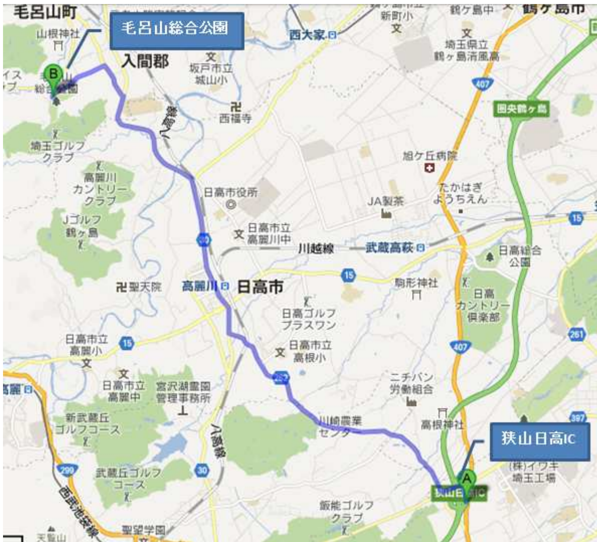
↑ 図：狭山日高IC→毛呂山総合公園