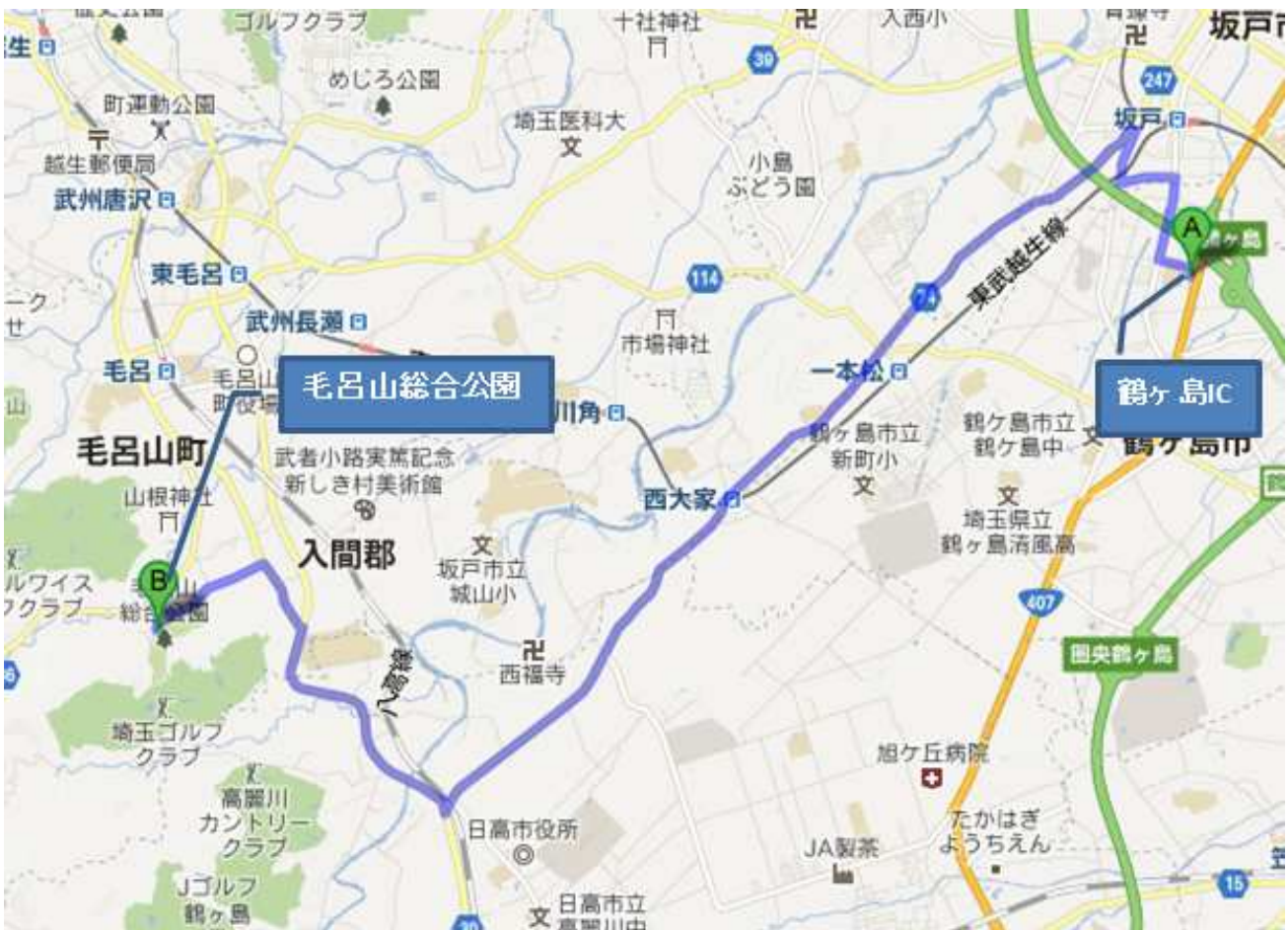
↑ 図：鶴ヶ島IC→毛呂山総合公園（地図データ ©2013 Google, ZENRIN）

駐車券は十分なスペースが確保できたため、発行いたしません。当日参加の方も駐車できます。 大会駐車場は臨時駐車場になります。会場案内図を参考に臨時駐車場にお越しください。 一般の駐車場は別のイベントの方が利用されますので使用はお控えください。