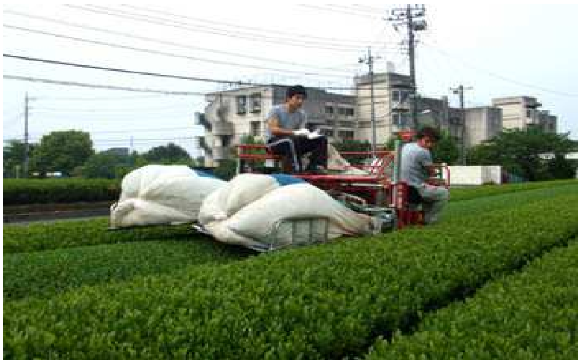
深い香りと 鮮やかなみどり お茶はやっぱり