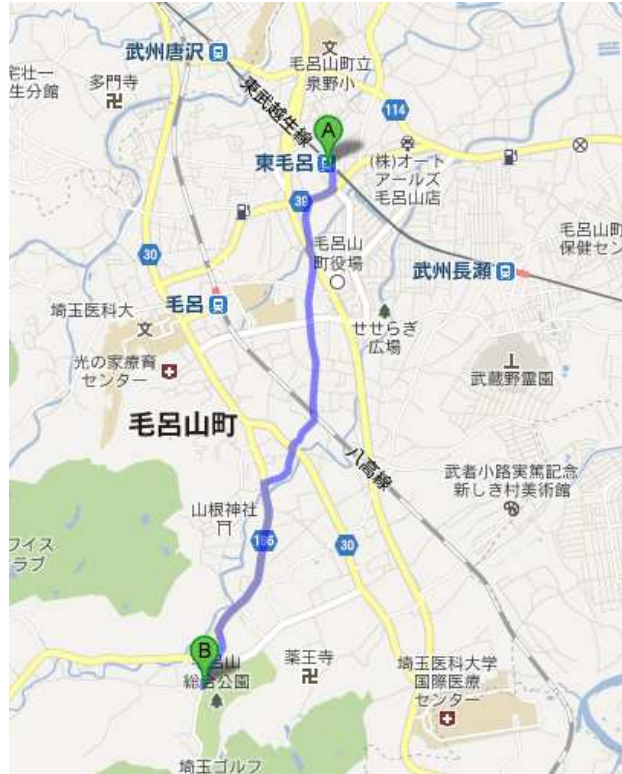
↑ 図：東武越生線「東毛呂駅」 →毛呂山総合公園