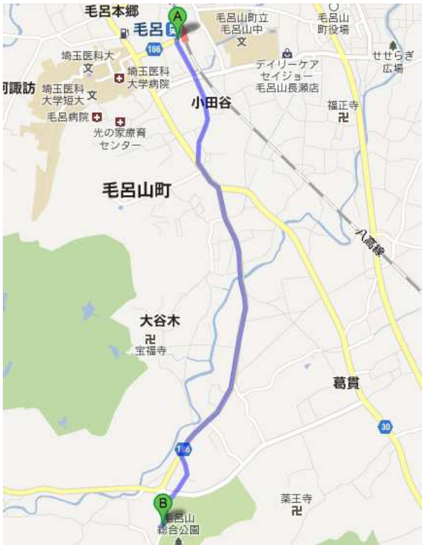
↑ 図：JR 八高線「毛呂駅」 →毛呂山総合公園