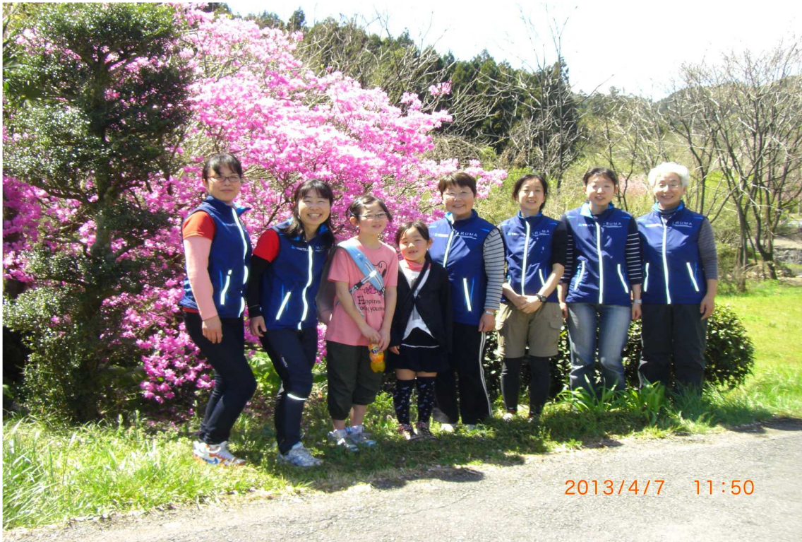
入間市OLCレディースの皆さん