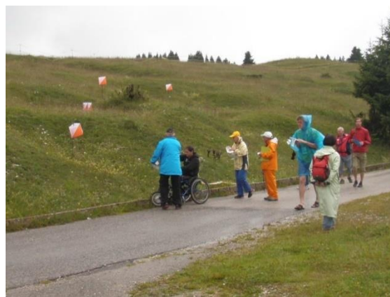
トレイルOの競技風景

また、全ての課題がTCとなっているTempOという競技もあります。一定数の課題を解くまでの時間を競います。誤解答にはペナルティタイムが加算されます。機会があればぜひ！