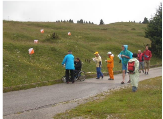
トレイルOの競技風景